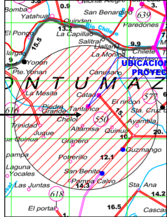
Mapa del Distrito de Contumazá – Santa Cruz de Toledo