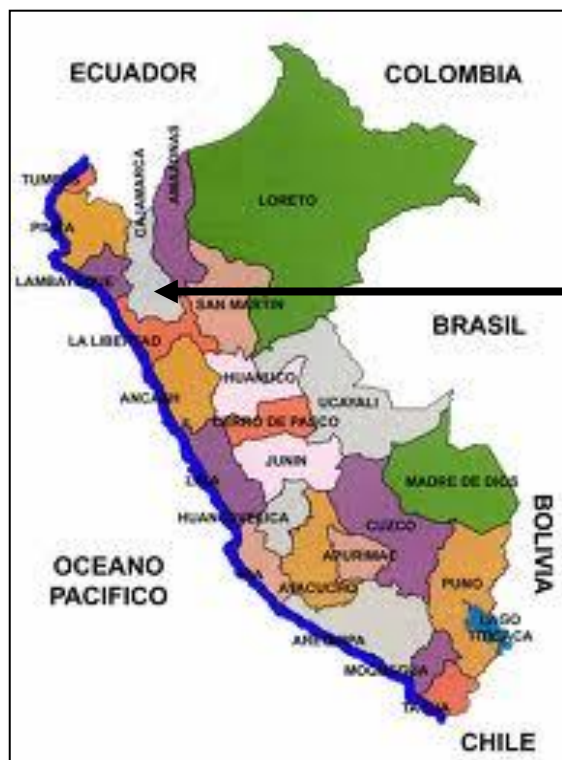
Mapa Político del Perú